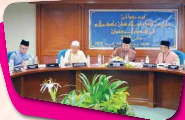
Persidangan Khas MAIPK 2015 pada 23 Mei 2015