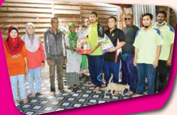
Jejak Asnaf MAIPK Slim River pada 25 Mei 2015