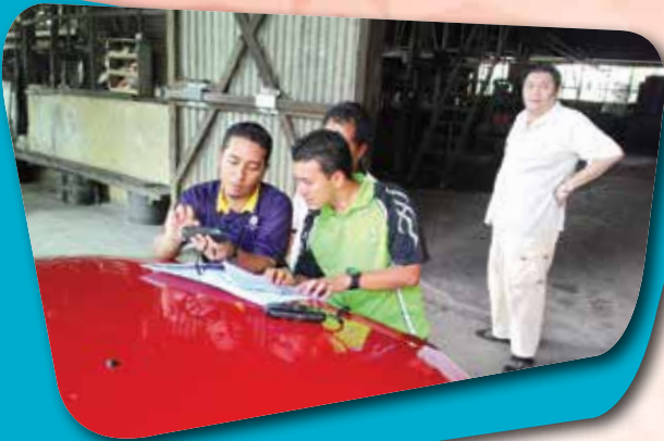
Ops Lengkap MAIPk Daerah Kampar berkaitan pencarian lokasi tanah-tanah wakaf pada 16 Jun 2015