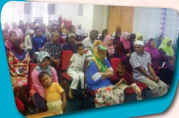
Program Motivasi Asnaf Daerah Tapah pada 19 Mei 2015