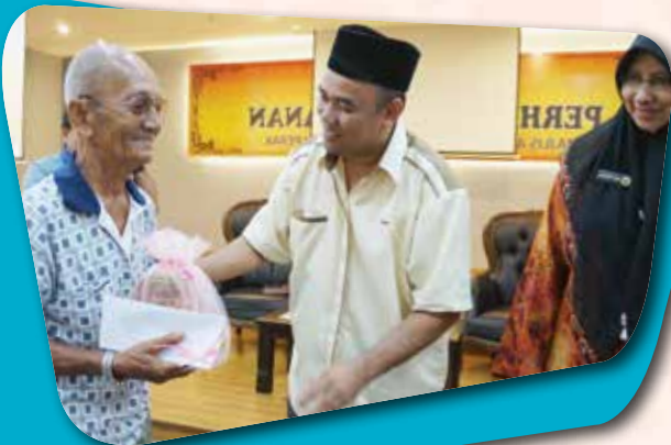
Majlis Penyerahan Bantuan Hari Raya 'Aidilfitri 1436H kepada Fakir Miskin Daerah Ipoh pada 13 Julai 2015