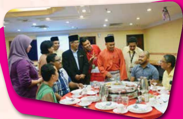
Majlis Ramah Mesra 'Aidilfitri 1436H dengan Wakil-Wakil Media Negeri Perak pada 07 Ogos 2015