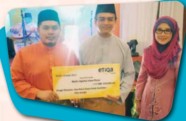
Penyerahan Zakat Perniagaan Etiqa Takaful Berhad kepada pihak MAIPK pada 10 Julai 2015