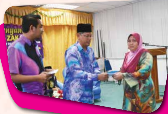
Majlis Penyampaian Bantuan Zakat MAIPK Daerah Slim River pada 11 Jun 2015