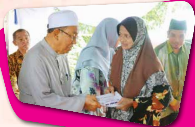
Majlis Penyerahan Bantuan Hari Raya 'Aidilfitri Epic Valley dengan kerjasama MAIPk Daerah Bagan Serai