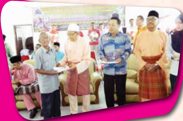
Majlis Penyerahan Bantuan Hari Raya 'Aidilfitri Epic Valley dengan kerjasama MAIPk Daerah Selama