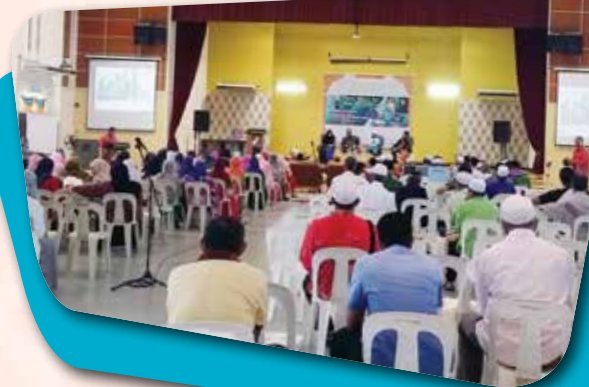
Forum Wacana Ilmu anjuran MAIPK Tapah dengan kerjasama Sek. Menengah Sains Mara Tapah pada 06 Jun 2015