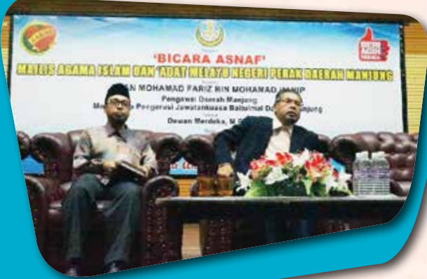
Bicara Asnaf MAIPK Daerah Manjung bersama Pegawai Daerah Manjung merangkap Pengerusi Bersama Jawatankuasa Baitulmal Daerah Manjung